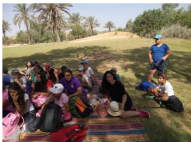
אין לי מושג...

יפה! חתיכת מסלול עשינו שם עם כיתה ה'. עד עכשיו השרירים תפוסים. זוה: