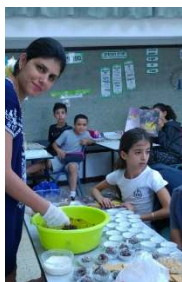
מפחיד אותי כל האש הזאת...

אז תן לי להרגיע אותך עם תמונה יפה של מים מהטיול השנתי של כיתות ו':